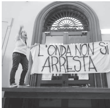
Una manifestazione dei ragazzi dell'Onda

benefit ai giardini San Leonardo di via Belmeloro (lo scopo è sempre quello di raccogliere fondi per le spese legali), i ragazzi si sono organizzati anche per la giornata di domani: una delegazione partirà alla volta di Torino, dove ci sarà un presidio fuori dal Tribunale del Riesame (l'udienza è alle 10.30), intanto altri faranno un presidio simbolico al Tribunale di Bologna sempre dalle 10.30. Intanto, sul web continuano ad aumentare gli appelli per la scarcerazione dei 21 studenti arrestati: oltre a quello già diffuso ieri e firmato da quasi 400 docenti e ricercatori di Atenei italiani e stranieri, ce n'è anche un altro («lettera aperta contro l'operazione Rewind») che sta girando nel mondo intellettuale. Tra le altre ci sono le firme di Dario Fo, Franca Rame, Gianni Vattimo, Sabina Guzzanti. La speranza dei ragazzi dell'Onda è che il Tribunale di Torino decida per la scarcerazione di tutti i ragazzi arrestati. Per il verdetto, i giudici del Riesame hanno cinque giorni di tempo, ma l'auspicio è quello che la decisione sia rapidissima.